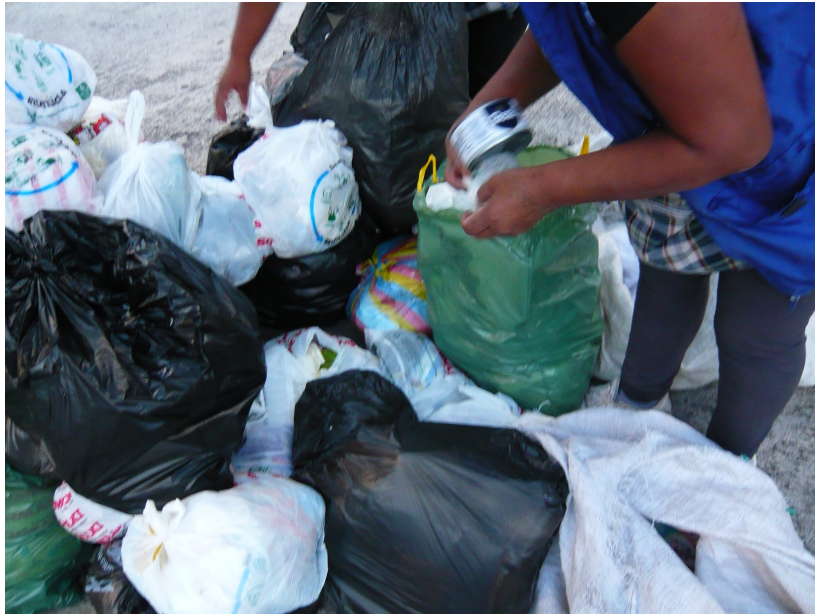
Fotografía 1. Recuperación de e materiales.