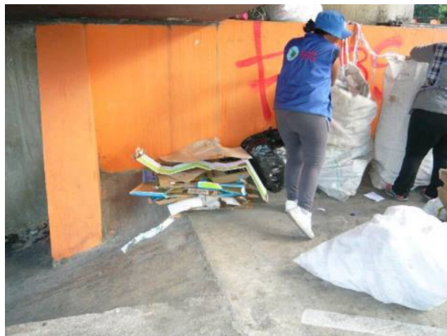
Fotografía 2. Almacenamiento de los materiales reciclados durante la jornada