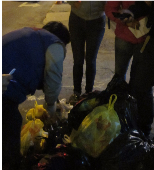
Fotografía 3. Proceso de identificación de materiales recuperables.